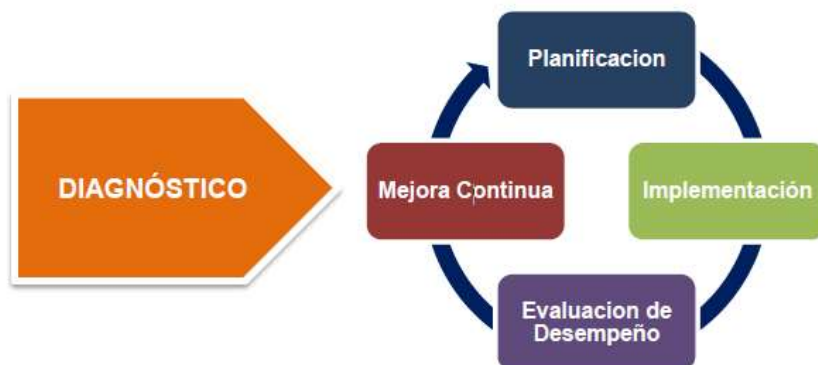
Figura 2: Ciclo de Operación del MSPI

El Modelo de Seguridad y Privacidad de la Información define un ciclo de operación que consta de cinco (5) fases, como se muestra en la siguiente figura; las cuales permiten que las entidades puedan gestionar adecuadamente la seguridad y privacidad de sus activos de información y esta como el componente principal de la política Gobierno Digital enfocado a preservar la confidencialidad, integridad y disponibilidad de la información.