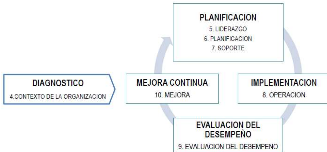
Figura 3: Fases Del MSPI Versus ISO-IEC 27001

¡Trabajamos por mi Nariño, tu salud, nuestro compromiso!