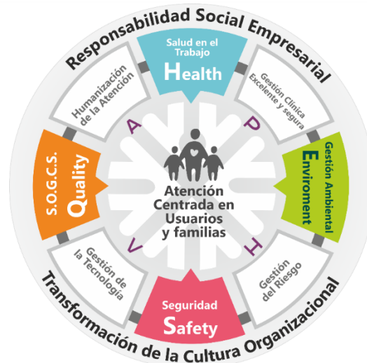
Figura 1. Modelo de atención al usuario

El HUDN es una organización basada en procesos, su mapa de procesos e interrelaciones representa una secuencia e interrelación de procesos que se puede evidenciar en la siguiente figura (HUDN, 2015)