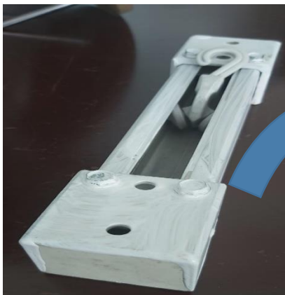
ACCESORIOS TERMINAL RIEL