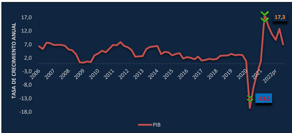
Gráfica 1. PIB TOTAL, Tasa de Crecimiento Anual. 2006-2022 pr8

¡Trabajamos por mi Nariño, tu salud, nuestro compromiso!