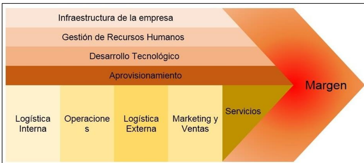
Ilustración 1. Cadena de Producción y Distribución

La distribución es aquel conjunto de actividades, que se realizan desde que el producto ha sido elaborado por el fabricante hasta que ha sido comprado por el consumidor final, y que tiene por objeto precisamente hacer llegar el producto (bien o servicio) hasta el consumidor.